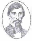
Alecu Russo 1819-1859

MINISTERUL EDUCAȚIEI ȘI CERCETĂRII INSPECTORATUL ȘCOLAR JUDEȚEAN BACĂU ȘCOALA GIMNAZIALĂ „ALECU RUSSO” BACĂU Str. Alecu Russo, Nr.5 TEL/FAX: 0234513383 e-mail: scoalaalrussobacau@gmail.com Nr. 240 din 10.02.2023